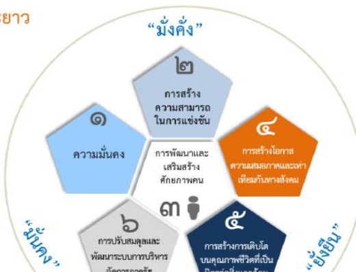
ความเชื่อมโยงของยุทธศาสตร์ชาติกับแผนในระดับต่างๆ

เพื่อให้บรรลุวิสัยทัศน์ “ประเทศไทยมีความมั่นคง มั่งคั่ง ยั่งยืน เป็นประเทศพัฒนาแล้ว ด้วยการพัฒนาตามปรัชญาของเศรษฐกิจพอเพียง” นำไปสู่การพัฒนาให้คนไทยมีความสุข และตอบสนองต่อการบรรลุ ซึ่งผลประโยชน์แห่งชาติ ในการที่จะพัฒนาคุณภาพชีวิต สร้างรายได้ระดับสูงเป็นประเทศพัฒนาแล้ว และสร้าง ความสุขของคนไทย สังคมมีความมั่นคง เสมอภาคและเป็นธรรม ประเทศสามารถแข่งขันได้ในระบบเศรษฐกิจ